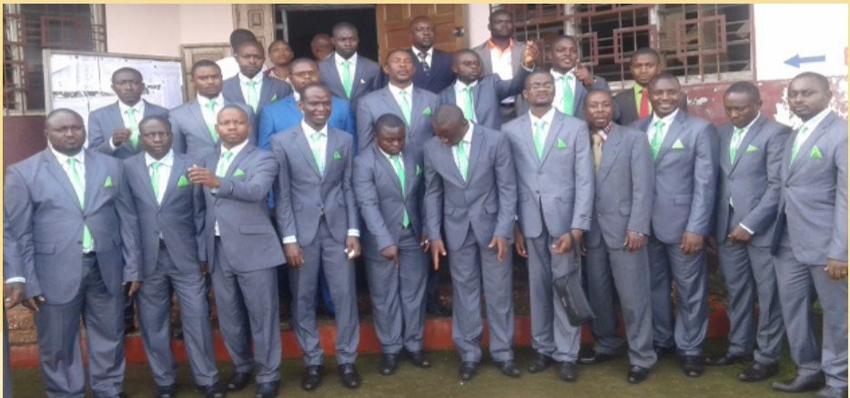
CÉLÉBRATION DE L'ANNÉE ACADÉMIQUE