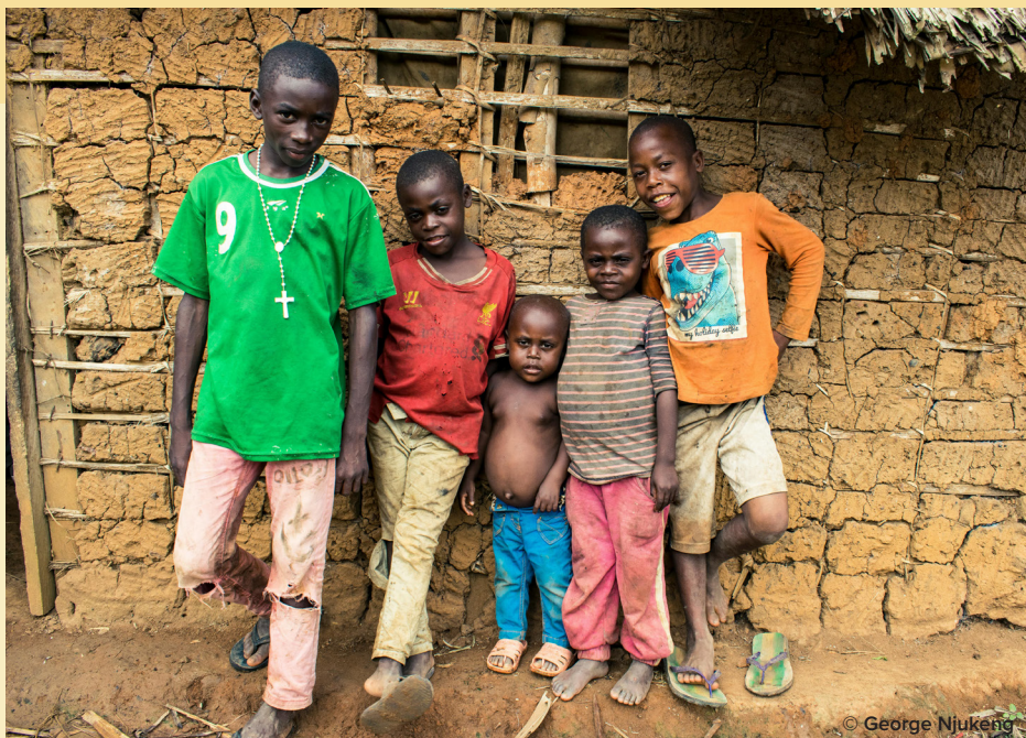
ENFANTS DES FAMILLES BAKOKO ET YAKALAK