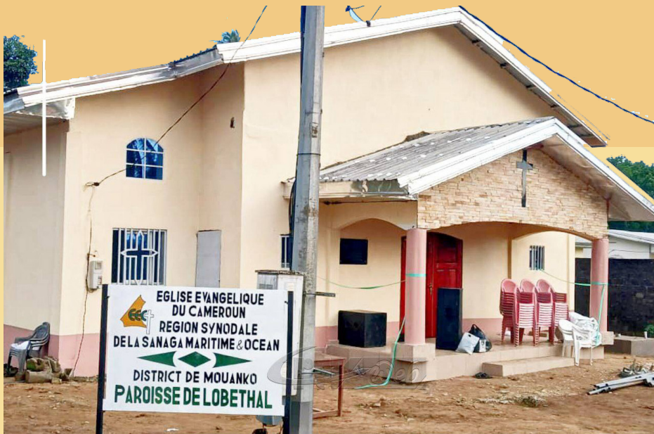
L'ÉGLISE DE LOBETHAL