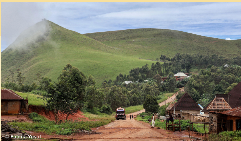
VILLAGE DE L'OUEST DU CAMEROUN

Ensemble, nous pouvons réellement faire la différence.