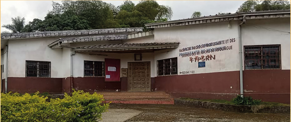
LE BLOC ADMINISTRATIF