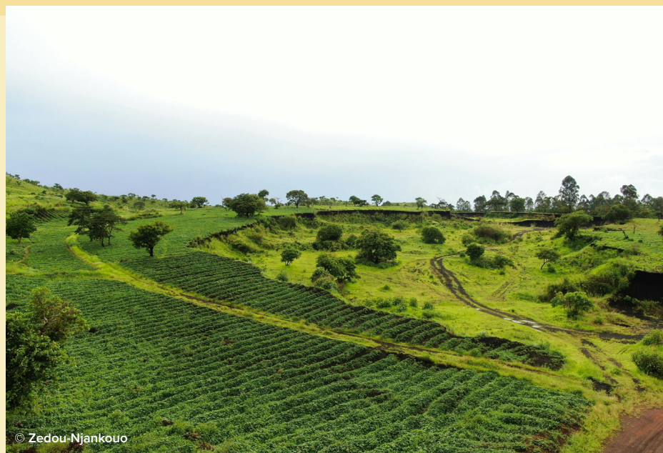
EN ROUTE VERS LE VILLAGE DE NDOUNGUÉ