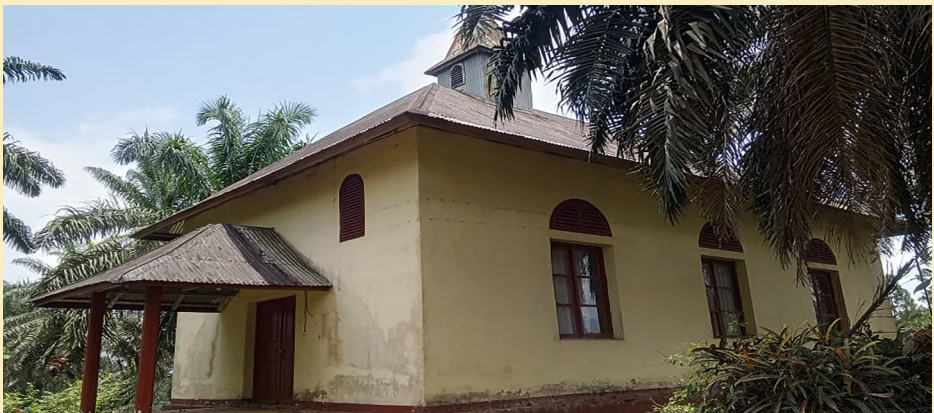
LA CHAPELLE ACADÉMIQUE