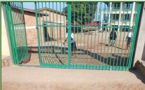
ENTRÉE OFFICIELLE DU CAMPUS