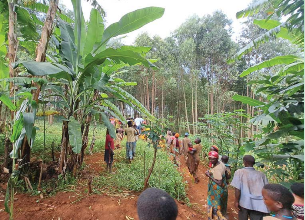
Vers le village Batwas