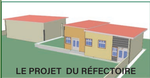
LE PROJET DU RÉFECTOIRE