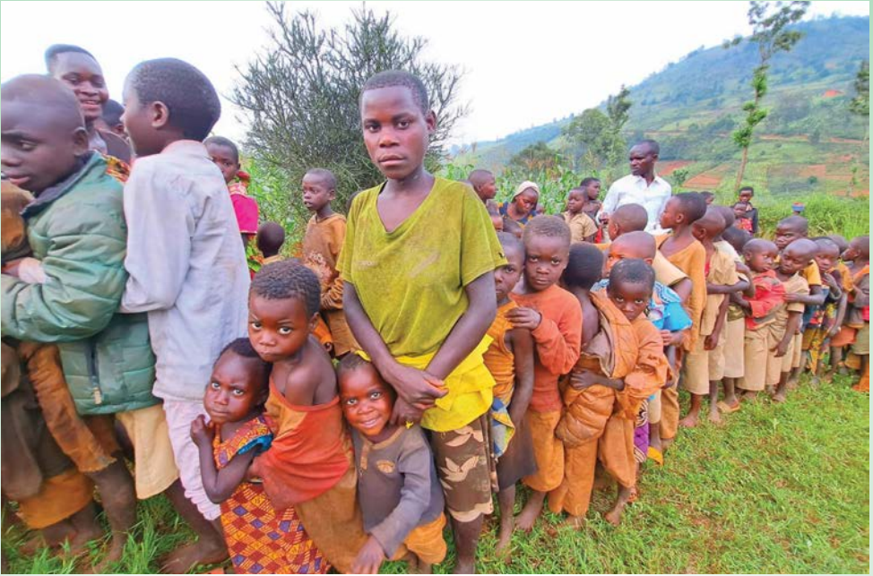
Distribution d'un colis de nourriture aux enfants