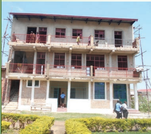
LES TRAVAUX CONTINUENT