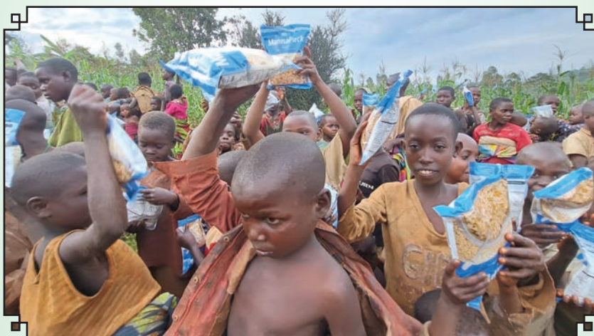
Les enfants Batwas reçoivent un colis de nourriture

Les Batwas de la zone de Mubuga sont là depuis plus de 20 ans. C'est grâce à un bienfaiteur qui a plaidé en leur faveur auprès de l'administration qu'ils ont acquis les terres où ils sont installés aujourd'hui. 116 maisons ont ainsi été construites à Kibogoye, Mushiha et Gihinga.