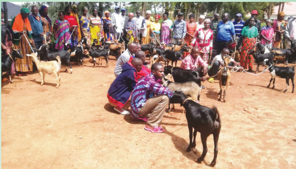
DISTRIBUTION DES CHÈVRES AU GROUPE "URUMURI-LUMIÈRE"