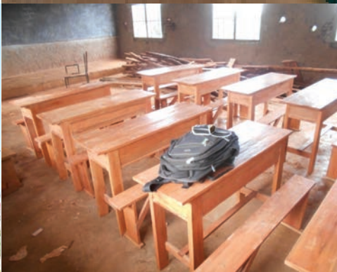
LES NOUVEAUX BANCS