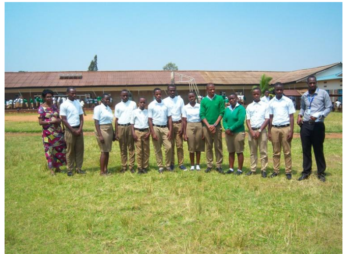
Foto onder: een aantal jongeren, op de scholengemeenschap in Remera-Rukoma., die uit het Studiefonds steun ontvangen.

Ik sprak enkele jongeren in 2014, die hun diploma haalden. Velen hebben nu een job in de kerk of in de samenleving.